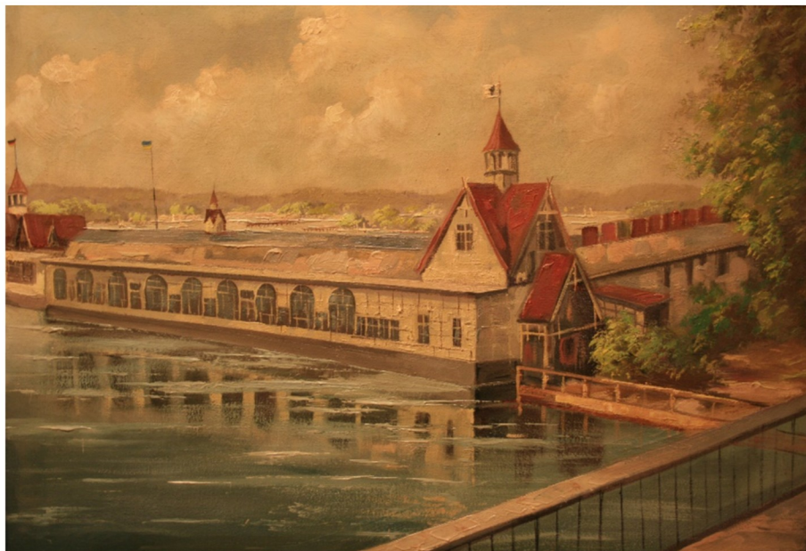
Deutsches Bad in Treptow (Ehemaliges Vereinsbad des SC Poseidon)

42. Nationales Kinderschwimmfest Karl-Wittenberg-Gedächtnisschwimmen 2026